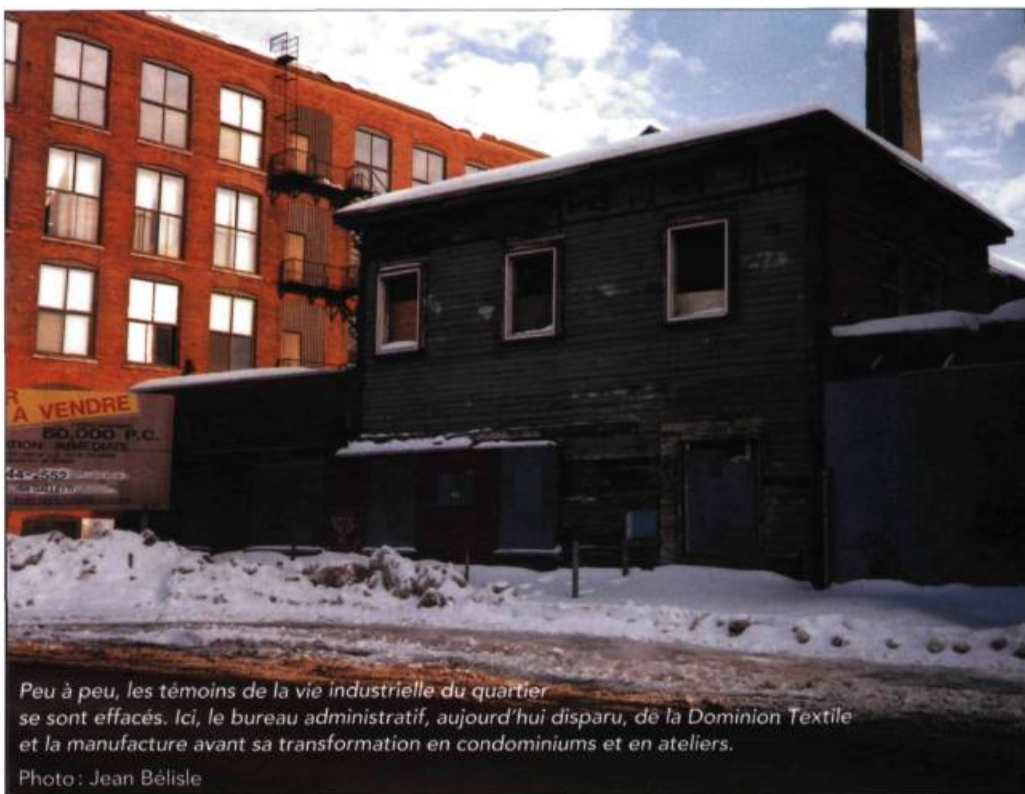
Peu à peu, les témoins de la vie industrielle du quartier se sont effacés. Ici, le bureau administratif, aujourd'hui disparu, de la Dominion Textile et la manufacture avant sa transformation en condominiums et en ateliers.

Depuis 25 ans, le paysage du canal de Lachine s'est sensiblement modifié. Au fil des démolitions et des fermetures, l'industrie y est devenue de plus en plus fantomatique. Rouvert depuis un an, le canal attire sur ses rives nombre de citadins que des promoteurs aux appétits féroces s'empressent de satisfaire. Dans cette déferlante d'intérêts divers, que deviennent les témoins du quartier industriel et laborieux ?