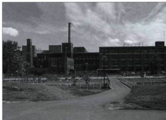
La Belding Corticelli dans les années 1980. Ce témoin important de l'industrie textile à Montréal est devenu depuis un bâtiment résidentiel.