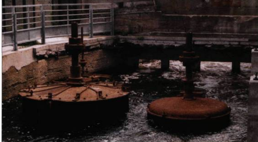
Sur le site des moulins du Sault-au-Récollet à Montréal, on peut voir d'anciennes turbines conservées in situ dans le canal d'amenée. Ces vestiges participent à la compréhension de l'histoire du lieu.

En 1977, le ministère des Travaux publics aménage l'actuelle piste cyclable. Un an plus tard, il transfère la responsabilité du canal de Lachine à Parcs Canada. Au cours des années 1980, les études se sont multipliées pour trouver une vocation à ce lieu. Pendant tout ce temps, le patrimoine industriel était laissé à son sort. Le corridor du canal de Lachine, dans son ensemble, a été reconnu lieu historique national en 1996, ce qui, aux yeux de plusieurs, représentait un incitatif pour protéger le caractère industriel du lieu. Cependant, cette mesure fédérale n'est assortie d'aucune mesure de protection pour les terrains pour la plupart privés qui bordent le canal. Malgré les efforts d'un grand