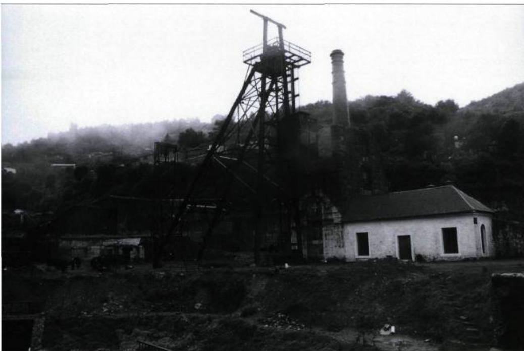
Le complexe minier de Real del Monte à Pachuca dans l'État d'Hidalgo au Mexique est en voie d'être restauré par le Museo de Minería.

Des associations dans divers pays s'intéressent au patrimoine industriel et regroupent des professionnels de plusieurs disciplines. La première conférence internationale sur la conservation du patrimoine industriel s'est tenue à Ironbridge en Angleterre en 1973. Elle a donné naissance au Comité international pour la conservation du patrimoine industriel (TICCIH), une organisation indépendante qui soutient les efforts de connaissance, de conservation et de valorisation du patrimoine industriel. Aux États-Unis, la Society for Industrial Archaeology (SIA) regroupe des Américains et des professionnels de plusieurs pays, dont le Canada. Elle a été fondée en 1971 lors d'une conférence tenue à la célèbre Smithsonian Institution à Washington. Le Mexique, qui possède des vestiges industriels s'échelonnant du XVI e au XX e siècle, a également son association de protection du patrimoine industriel, le Comité mexicano para la conservación del patrimonio industrial (CMCPI). Au Québec, l'Association québécoise pour le patrimoine industriel (AQPI) a été fondée en 1988 pour sensibiliser les autorités, les intervenants en patrimoine et la population en général à l'importance du patrimoine industriel.