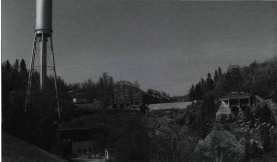
Le site de la Pulperie de Chicoutimi (ici tel qu'il se présentait avant l'inondation de 1996) témoigne de l'activité de la Compagnie de pulpe de Chicoutimi, fondée en 1896. Cette entreprise a été un moteur économique important pour la région.