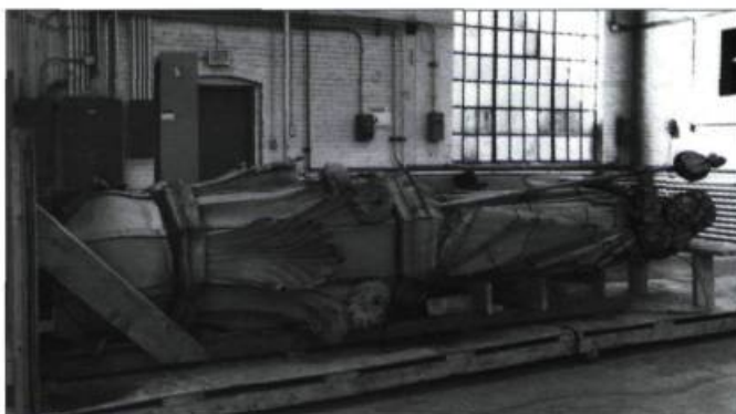
On voit ici la statue dans un entrepôt de l'UQAM avant restauration. On a dû l'amputer de la partie inférieure du pinacle qui lui servait de socle afin de la fixer plus solidement sur la façade de la transept sud.

Olindo Gratton (1855-1941) et Philippe Laperle (1860-1934) étaient des artistes du voisinage. De 1881 et 1882, respectivement, jusqu'en 1888, ils avaient été les employés du sculpteur Louis-Philippe Hébert. Quand celui-ci s'est installé à Paris en 1888, ils se sont associés tout en continuant d'occuper l'atelier d'Hébert, rue Labelle, au sud de la rue Sainte-Catherine. Admiré par la presse montréalaise lors de sa réalisation, le Saint Jacques le Majeur a contribué à établir leur réputation en tant que sculpteurs autonomes.