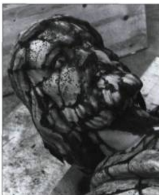
Avant la restauration, les soudures du recouvrement en cuivre nuisaient à la lecture de l'œuvre.