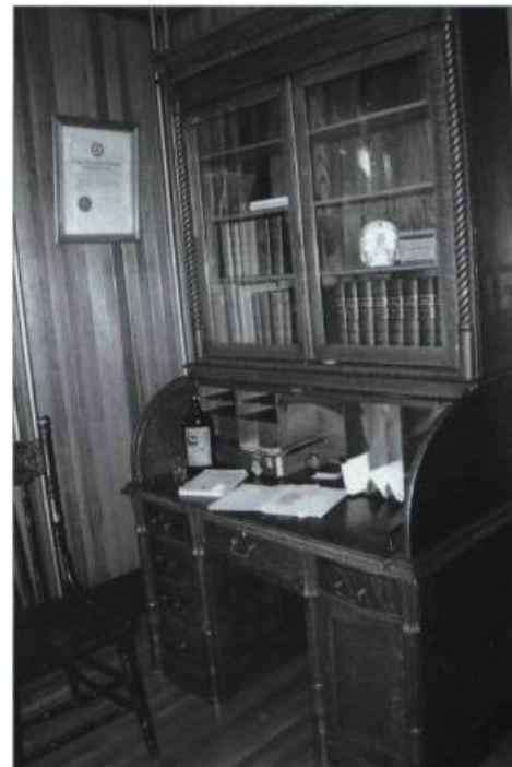
Le bureau du D' Chabot tel qu'il était durant ses années de pratique, de 1900 à 1972.