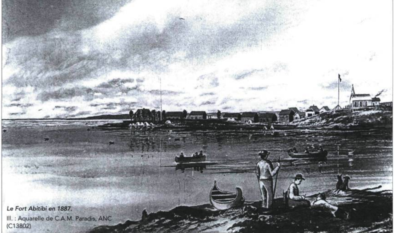
Le Fort Abitibi en 1887.

Ill. : Aquarelle de C.A.M. Paradis, ANC (C13802)