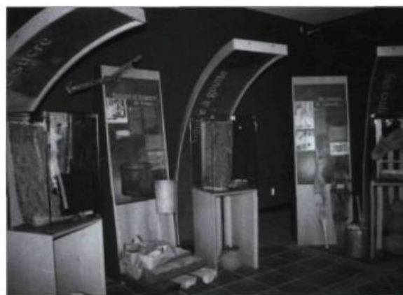
« De l'eau... à la bouche », l'exposition permanente de la Maison des cultures amérindiennes est une entrée en matière pour le visiteur qui souhaite apprivoiser les saveurs et les traditions culinaires amérindiennes.