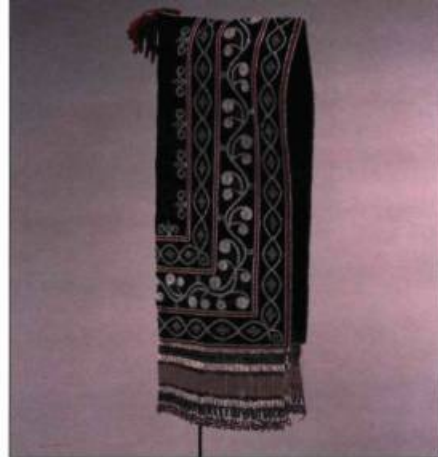
Photo : Musée McCord, don de M.C.S. Rackstraw au Musée McCord, ME954.1.2

Ce capuchon, création d'une femme crie de la Baie-James vers 1850, est fait de drap de Stroud bleu et décoré de rubans de soie, de coton et de perles de verre.