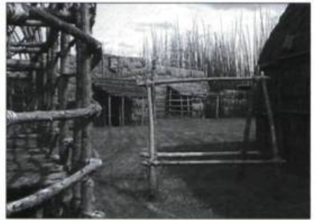
Les maisons longues étaient l'habitation type de ces groupes d'Amérindiens. Généralement, les villages étaient ceinturés d'une palissade qui protégeait des envahisseurs et des intempéries.