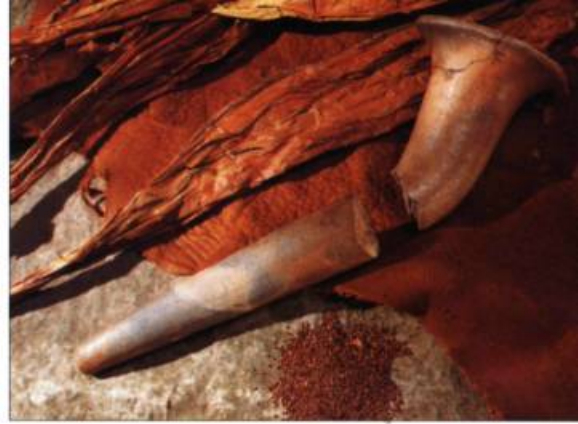
Les pipes en argile et le tabac retrouvés sur le site Droulers témoignent de l'importance de fumer pour les Iroquoiens. Une action qui revêtait un caractère religieux.