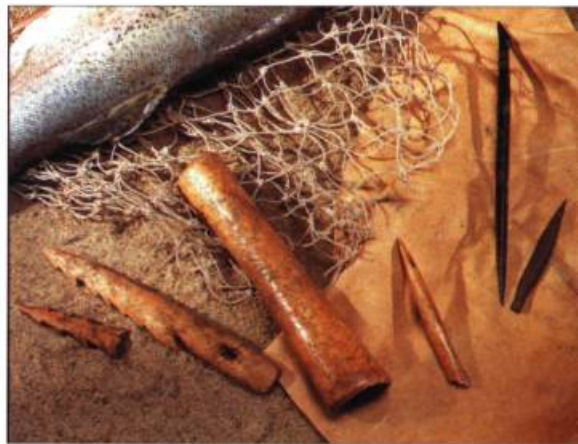
Les groupes iroquoiens de la région de Saint-Anicet utilisaient les os de diverses espèces de mammifères, dont le chevreuil et l'ours, pour fabriquer les outils servant à la chasse et à la pêche. Ceux-ci proviennent du site Droulers.