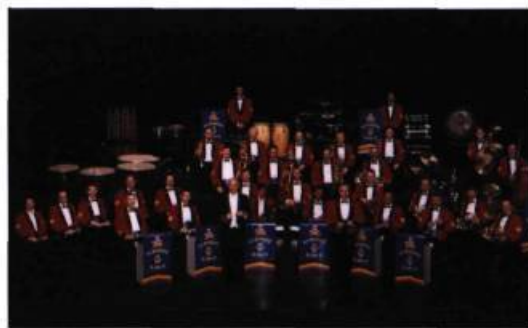
La Musique du Royal 22 e Régiment.

La tradition des fanfares tire ses origines des débuts du Régime anglais au Québec. Les ensembles étaient alors de toutes les cérémonies officielles. Les musiciens militaires ont de tout temps contribué au financement de causes sociales en participant à des concerts-bénéfice. La popularité des ensembles militaires est plus vivante que