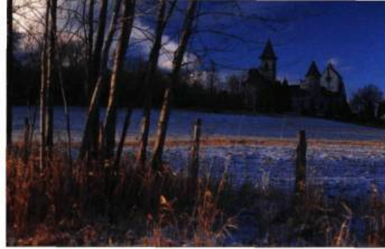
L'abbaye de Saint-Benoît-du-Lac.