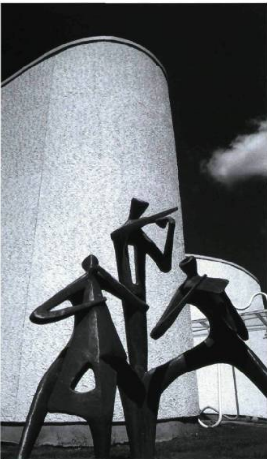
Le Centre d'Arts Orford.

Musique et patrimoine bâti font bon ménage. Ils sont en effet légion les lieux de concerts et de spectacles qui associent intimement musique et patrimoine bâti. Certains de ces lieux ont été conçus pour la musique et le spectacle, d'autres en ont fait leur nouvelle vocation. Pensons par exemple aux églises qui, en raison de l'espace, de l'acoustique et de l'orgue