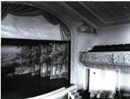
La Haskell Free Library and Opera House.

Chapelle des Sœurs du Bon-Pasteur, 1080, rue de la Chevrotière. 1866-1868, Charles Baillairgé, architecte. 1909, agrandissement par l'avant, François-Xavier Berlinguet, architecte. Classée en 1975. Décor intérieur classique de Baillairgé. Messe des artistes du regroupement FideArt à tous les dimanches. Acoustique appréciée entre autres pour l'enregistrement de musique de chambre.