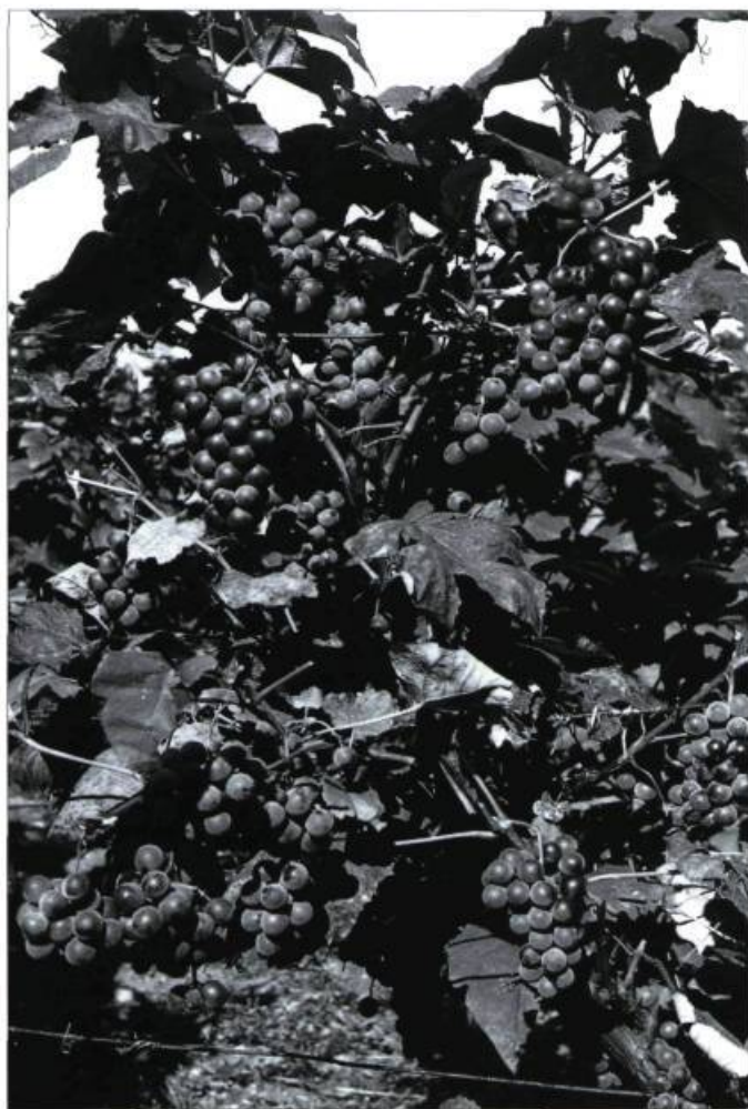
Vigne des Pères trappistes à Oka en 1943.