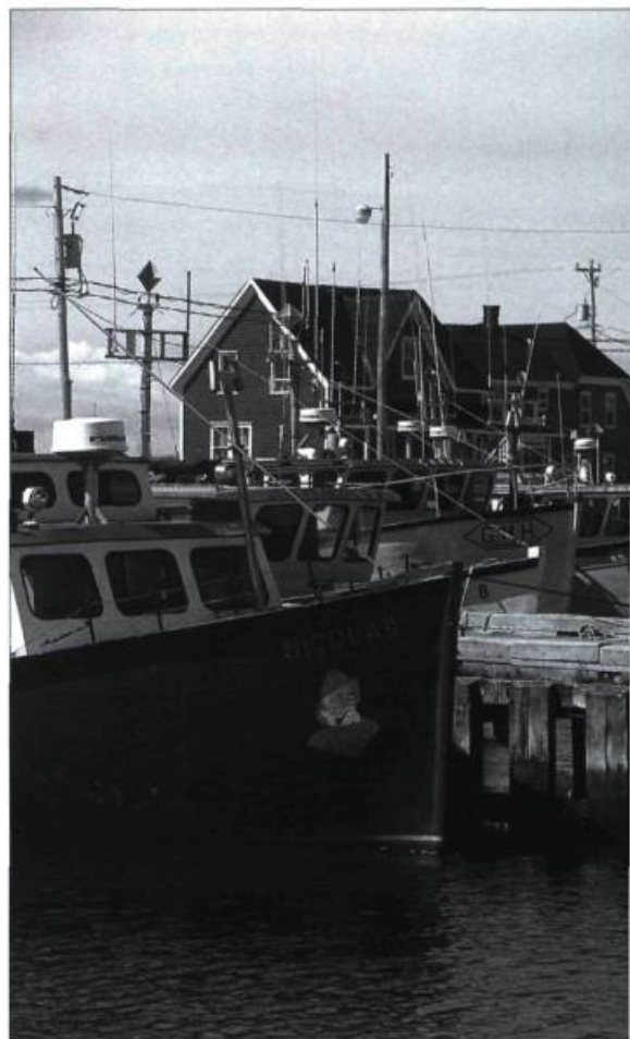
Servant de port d'attache pour les pêcheurs de homard de Grande-Entrée aux Îles-de-la-Madeleine, ce quai extrêmement actif sera agrandi au cours de la prochaine année.

Enfin, des administrations portuaires autonomes (APA) ont été constituées à Montréal, Trois-Rivières, Québec, Port-Saguenay et Sept-Îles. Et Transports Canada s'apprête à céder les quais de Portneuf, Pointe-au-Pic, Cacouna, Mont-Louis, Gaspé et Havre-Saint-Pierre. Dans l'estuaire du Saint-Laurent, aucun port n'est classifié de pêche, ce qui réduit la plupart des ports à un statut de plaisance, ce dont on se débarrasse.