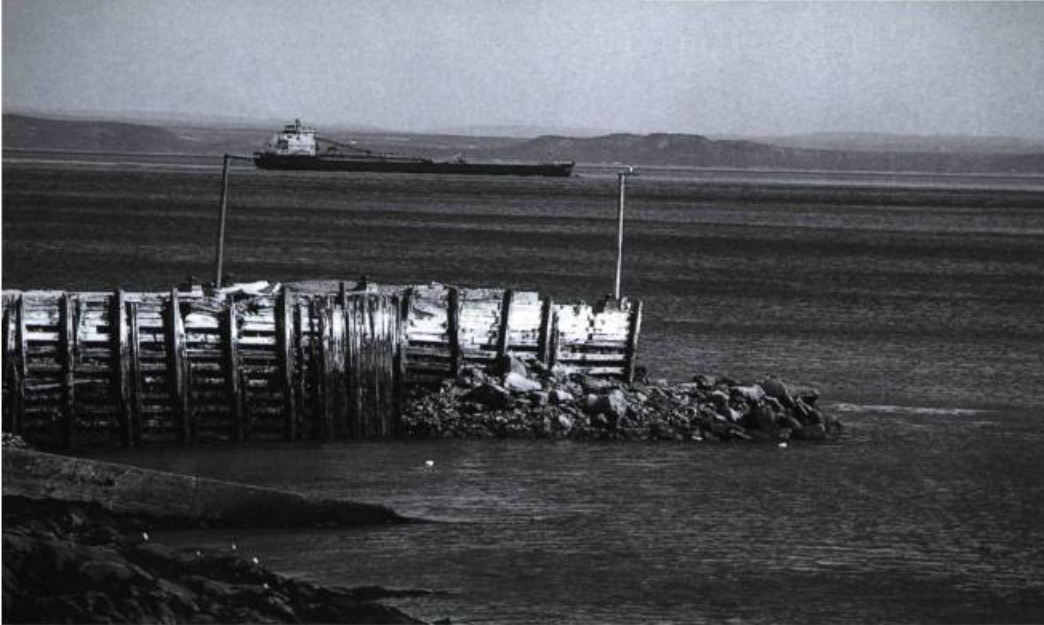
Le quai de Port-au-Persil fait partie de l'un des paysages les plus pittoresques du Québec. Sera-t-il consolidé ou le laissera-t-on disparaître dans l'indifférence ?