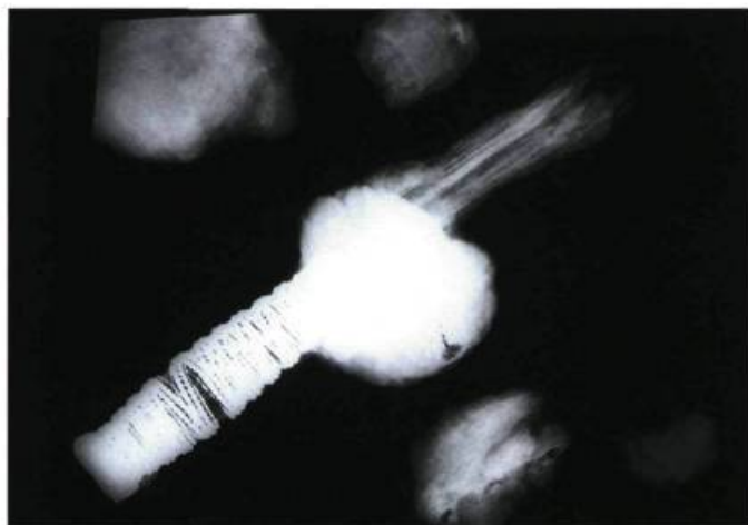
La radiographie d'une fusée (poignée) d'épée ne permettait pas de voir que le fourreau en bois était recouvert de cuir. En effet, les textiles, les verres, les cuirs et même les gros cordages laissent passer les rayons X sans laisser de trace visuelle sur la pellicule.