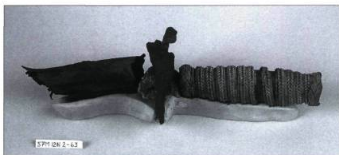
L'épée après traitement. Il s'agit d'une magnifique fusée d'épée en argent tressé sur une âme en bois. Il a été difficile de dégager les fragments de la garde, cette fine pièce de métal ayant entièrement laissé place à la concrétion. Malgré tout, les éléments de décor sont visibles sous certains angles et les chercheurs en culture matérielle peuvent identifier le style de l'épée et le statut social de son propriétaire.