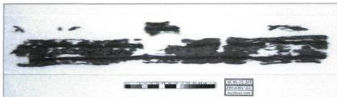
Malgré trois siècles d'immersion en eau salée, ce fin ruban de soie a été préservé.