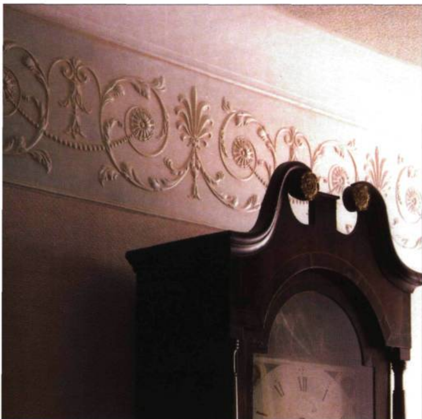
À gauche, une frise décorative de type lincrusta (Steptoe & Wife, RD 1958) et à droite, un exemple du revêtement mural de type anaglypta (Steptoe & Wife, RD 326).

Le lincrusta et l'anaglypta sont alors apparus pour mettre du relief dans les intérieurs.