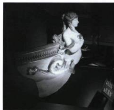
Proue du canot de promenade de la reine Marie-Antoinette (1755-1793). Construite en 1777, l'embarcation royale voguait silencieusement sur le grand canal des jardins du château de Versailles.

L'exposition des trésors du Musée national de la Marine de Paris, un des plus vieux musées maritimes du monde, est présentée au Musée de la civilisation jusqu'au 6 janvier 2002. Peintures, gravures, sculptures, instruments de navigation, cartes et photographies sont au nombre des 200 chefs-d'œuvre que l'institution française a prêtés au Musée de la civilisation dans le cadre de cette exposition. Le clou de l'exposition est sans conteste les 33 maquettes de navires réalisées à l'échelle qui représentent autant de vaisseaux, galères, navires à vapeur, cuirassés et goélettes. C'est un rendez-vous unique avec l'histoire navale de la France depuis le XVII e siècle. Un catalogue d'exposition a été produit pour l'occasion. Québec. Information : (418) 643-2158.