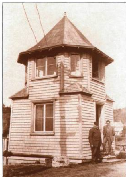
Le poste de garde, construit vers 1897, abritait le gardien qui veillait à ce que les immigrants placés en observation ne franchissent pas les limites du secteur ouest où ils étaient confinés.