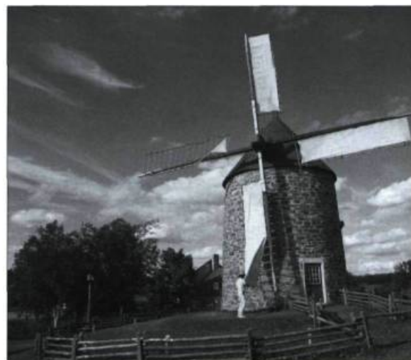
L'un des quatre derniers moulins à vent du Québec à posséder encore son mécanisme d'origine, le moulin à vent Desgagné (classé en 1962) se trouve à la pointe ouest de l'île aux Coudres. Construit en 1836 sur les ruines du premier moulin érigé en 1762, il se trouve à proximité d'un moulin à eau construit en 1826 et classé en 1963.

La beauté des lieux continue de faire courir les foules année après année. Les gens viennent à l'île d'Orléans pour vivre « un trois heures d'enchantement, se laisser bercer par la tranquillité et par la beauté de l'architecture », dit Pierre Lahoud, historien et responsable de l'arrondissement historique de l'île d'Orléans au ministère de la