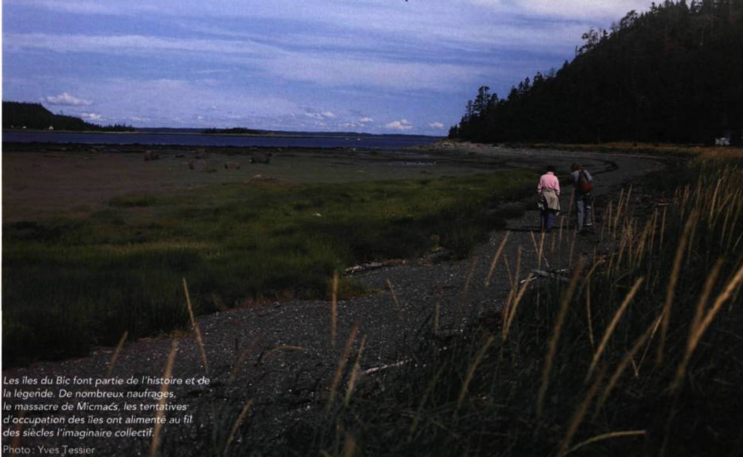
Les îles du Bic font partie de l'histoire et de la légende. De nombreux naufrages, le massacre de Micmacs, les tentatives d'occupation des îles ont alimenté au fil des siècles l'imaginaire collectif.

Si les îles présentent un intérêt certain pour la flore et la faune, elles sont depuis longtemps reconnues comme des terrains d'étude privilégiés pour l'observation de microsociétés et de phénomènes culturels, sociologiques ou démographiques. Au Québec, un grand nombre d'études, de thèses et d'articles ont porté sur les caractères originaux des îles et de leurs habitants, ainsi que sur leurs relations avec l'environnement. Dans sa Description de la culture de l'île Verte (1954), Marcel Rioux définit les fondements de la culture cana-