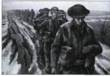
Fantassins près de Nimègue, en Hollande, œuvre de David Alexander Colville.

Cette exposition est présentée au Musée canadien des civilisations jusqu'au 7 janvier 2001. Hull. Information: (819) 776-7167.