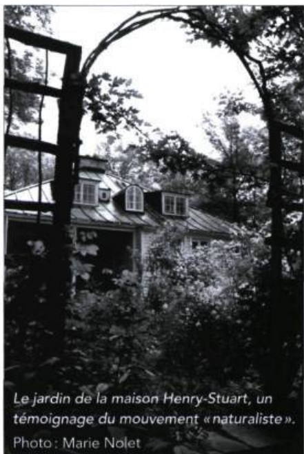
Le jardin de la maison Henry-Stuart, un témoignage du mouvement « naturaliste ».

Il faut attendre 1988 pour voir l'État québécois accorder à un jardin le statut de bien culturel en vertu de la Loi sur les biens culturels. Le jardin de la maison Henry-Stuart, à Québec, est le premier à être reconnu pour ses caractéristiques culturelles et patrimoniales propres et non pas en tant que prolongement d'un bâtiment historique. Avec la maison et ses intérieurs, le jardin Henry-Stuart forme une entité protégée indissociable. Plus récemment, le Canada reconnaissait la valeur patrimoniale de chaque composante en désignant la maison Henry-Stuart et son environnement monument et lieu historique national.