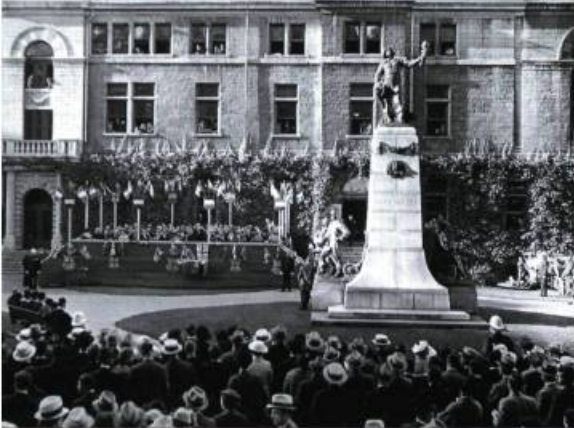
Les manifestations commémoratives sont très populaires à la fin du XIX e et au début du XX e siècle. Ici, une fête rappelant le 400 e anniversaire du voyage de Jacques Cartier, en face du monument Louis Jolliet et de l'hôtel de ville de Québec en 1934.

aussi connu une inflation importante au cours des dernières années. La qualité esthétique d'un bien et sa valeur documentaire sont toujours au nombre des raisons invoquées pour sélectionner les objets de patrimoine. Mais, au fil des ans, des critères d'usage, d'intégrité, de position dans l'espace bâti, et même d'attachement ou d'appropriation par le milieu, s'y sont ajoutés.