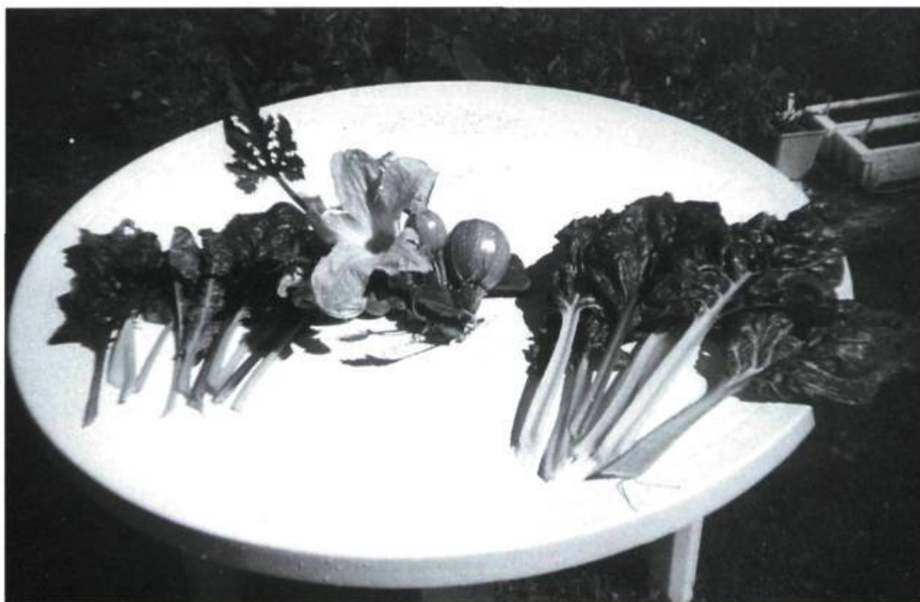
À gauche et à droite : bettes à carde « Bright light » qui se présentent en cinq couleurs. Au centre : C. Peppo zucchini « Ronde de Nice », variété cultivée en France avant 1900. Cette plante est à son meilleur lorsqu'elle atteint la taille d'une balle de golf.

Un organisme à but non lucratif nommé Programme semencier du patrimoine Canada (Seeds of Diversity Canada) se voue à la recherche et à la sauvegarde des variétés anciennes de plantes cultivées (légumes, fruits, céréales, fines herbes et fleurs). Le slogan de l'organisme est « Nous sommes une banque vivante de gènes ». Il s'agit en fait du seul réseau canadien d'échange (privé) et de préservation de variétés à polénisation libre (qui peuvent se reproduire par elles-mêmes), si les bonnes techniques pour préserver la pureté des variétés sont appliquées. Fondé en 1984, l'organisme regroupe 1300 membres (dont 267 au Québec) répartis de Terre-Neuve à la Colombie-Britannique. Les membres sont tantôt des particuliers qui cultivent un potager, tantôt des agriculteurs soucieux d'appliquer les principes de la biodiversité dans leur pratique. On y retrouve aussi des responsables de lieux historiques et de jardins botaniques ainsi que des historiens de l'horticulture. Dans leur potager, leur ferme ou leur jardin historique, des producteurs