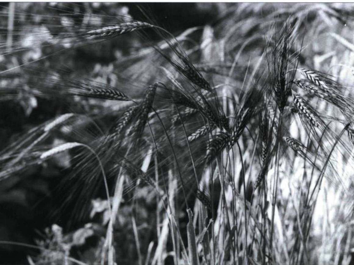
Blé bleu « Utrecht ». Variété décorative de blé de printemps cultivée depuis le début du siècle aux Pays-Bas.