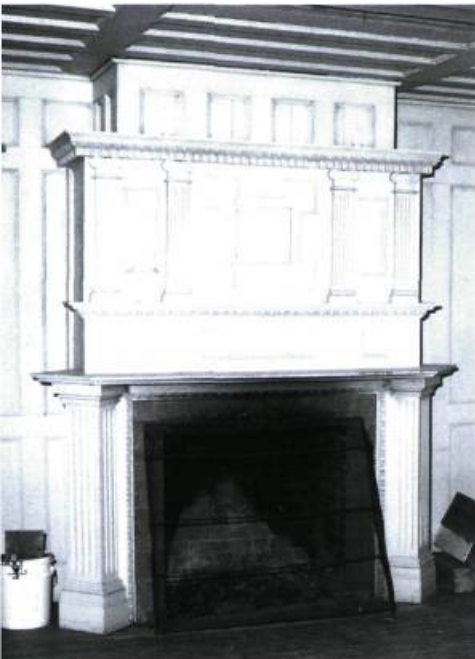
Illustration : Denis Désilet

et la partie supérieure du mur sera recouverte de plâtre peint, ce qui augmentera la luminosité de la pièce.