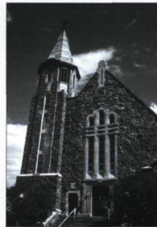
L'église de Sainte-Amélie.