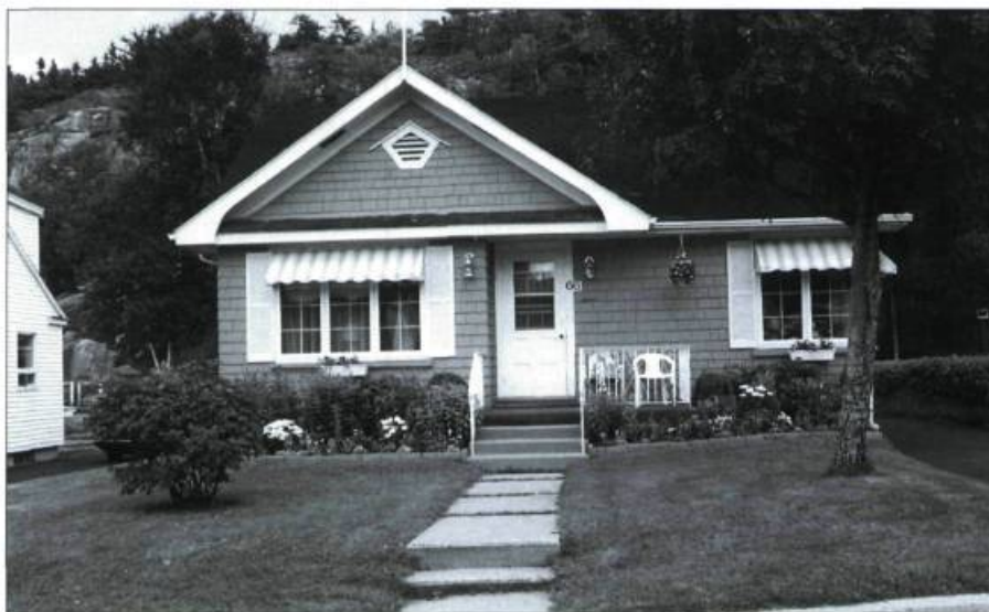
Une des petites maisons de la rue Laval.

Un tel objectif ne peut être atteint sans la collaboration des résidents. La municipalité doit par conséquent élaborer de vrais outils de gestion, tel un plan d'implantation et d'intégration architectu-