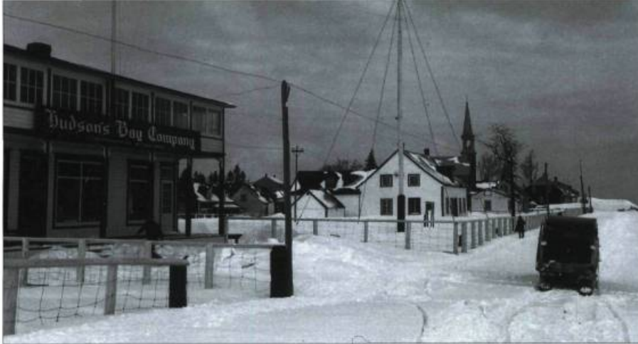
Betsiamites, à environ 50 kilomètres en amont de Baie-Comeau, en janvier 1945. À gauche, un comptoir de la Compagnie de la Baie d'Hudson, établie dans le village en 1855.