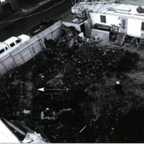
Vue des fondations du môle des quais Lyburner & Crawford. Il s'agit d'ouvrages de maçonnerie en pierre sèche composant l'armature d'un quai obstruant partiellement l'entrée du bassin situé plus à l'ouest.