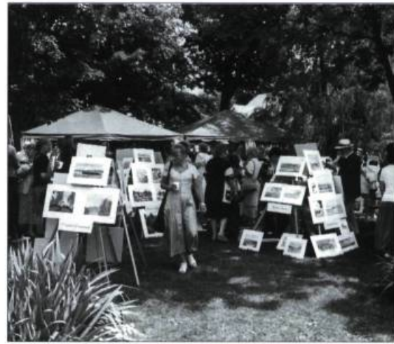
Une foule importante se pressait à Saint-Michel-de-Bellechasse à l'occasion de l'édition 1998 de l'Art en Fête.

Le 2 août dernier s'est tenue à Saint-Michel-de-Bellechasse la première édition de l'Art en Fête. Plus d'une quarantaine d'aquarellistes ont exposé leurs œuvres représentant différents traits patrimoniaux et touristiques de Saint-Michel. Pas moins de 2500 personnes ont participé à cet événement qui devrait se répéter l'an prochain. À Saint-Michel-de-Bellechasse, comme dans plusieurs autres villes et villages du Québec, la mise en valeur du patrimoine bâti ainsi que la promotion des arts et de la culture font désormais partie intégrante du produit touristique culturel. Ce vieux bourg, datant du Régime français et situé dans un cadre naturel enchanteur, est en voie de devenir l'exemple parfait de la conjonction nature et culture.