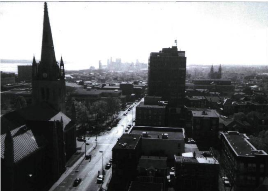
Le centre-ville de Trois-Rivières en 1997. Au centre, l'immeuble Place-Royale, un édifice « moderne » des années 1960.