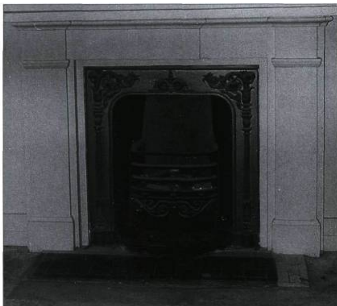
Simplicité d'un manteau de cheminée tournant de siècle, dont le foyer a été rétréci à l'aide d'une grille décorée de colonnettes et de motifs floraux, pour y aménager un poêle décoratif à charbon.