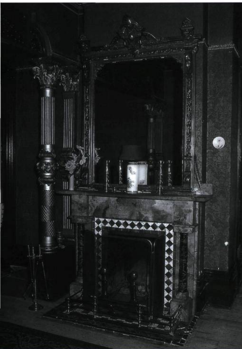
Maison Mitchell, Drummondville. Illustration typique d'un manteau de cheminée victorien au décor éclectique, où s'agencent marbre, tuiles et métal. Fréquemment, comme ici, le manteau était couronné d'un large miroir biseauté, ceinturé d'un cadre de métal ouvragé.

On peut imaginer le décor rudimentaire des premiers manteaux de cheminée des habitations rurales: un foyer maçonné de pierres grossièrement équarries ou, même, simplement fait de moellons des champs, couvert d'un gros linteau de pierre ou de bois au-dessus duquel trône un vieux vase ou un chandelier. Par ailleurs, pour une même époque, une demeure à la ville ou un palais pouvait présenter un manteau au décor élaboré et remarquable, comme celui illustré sur une élévation du « Palais dans la ville de Québec » de l'ingé-