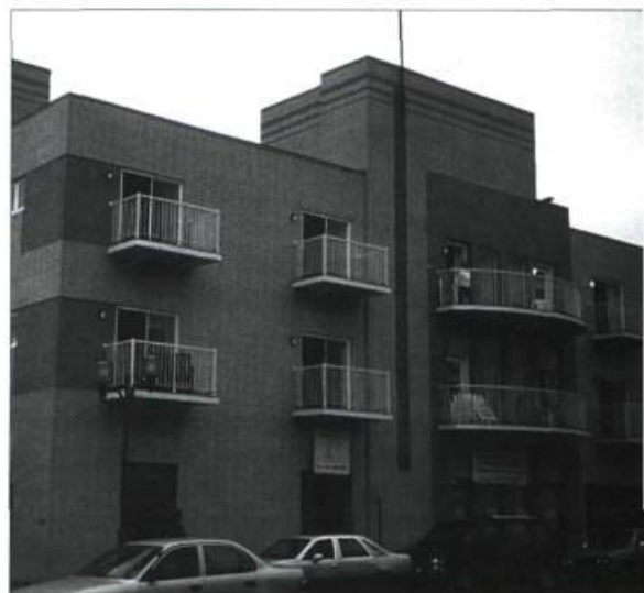
Cet ancien édifice à bureaux, vacant à plus de 80 % pendant plusieurs années, a subi des transformations majeures. C'est aujourd'hui un édifice à logements pour retraités.

Le sauvetage du centre-ville de Chicoutimi nous a appris que si on laisse se dévitaliser un arrondissement commercial, ses fonctions industrielle et résidentielle suivront peu à peu, transformant le quartier en zone urbaine à la dérive. À Chicoutimi, nous avons réussi à stopper ce dépérissement grâce à d'intenses efforts et à l'appui d'une communauté dynamique qui a concocté une stratégie de réappropriation du territoire axée sur de nouvelles vocations urbaines.