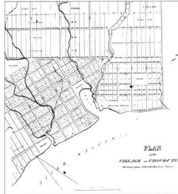
Plan du village de Chicoutimi, Ballantyne, 1845.

Cette division de la ville correspond également à des espaces sociologiques à l'intérieur desquels les grandes familles et les acteurs sociaux prennent place. Ainsi, le quartier ouest est lié étroitement à la maison Price, qui constitue le plus gros employeur de la ville. Le quartier centre est associé à la famille Guay, dont le chef de famille et les membres de la succession sont de toutes les initiatives, depuis le renouvellement de l'agriculture vers l'industrie laitière et l'industrie fromagère, la fondation d'un journal régional, Le Progrès du Saguenay , jusqu'au téléphone et à la grande industrie. Le quartier est, enfin, est rattaché aux professions libérales, au clergé et aux communautés religieuses. L'architecture institutionnelle, qui sera complétée en 1882 avec l'hôpital de la Marine, dominera cet espace.