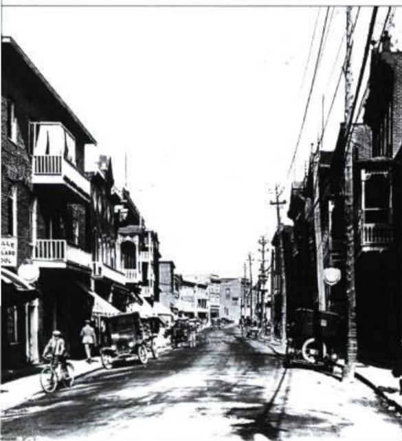
Le haut de la rue Racine vers 1920.

est, à proximité du quai gouvernemental et du secteur institutionnel, le terminus ferroviaire permet de donner un nouvel élan à la socio-économie du milieu en plaçant Chicoutimi sur la carte des réseaux de chemin de fer canadien et américain.