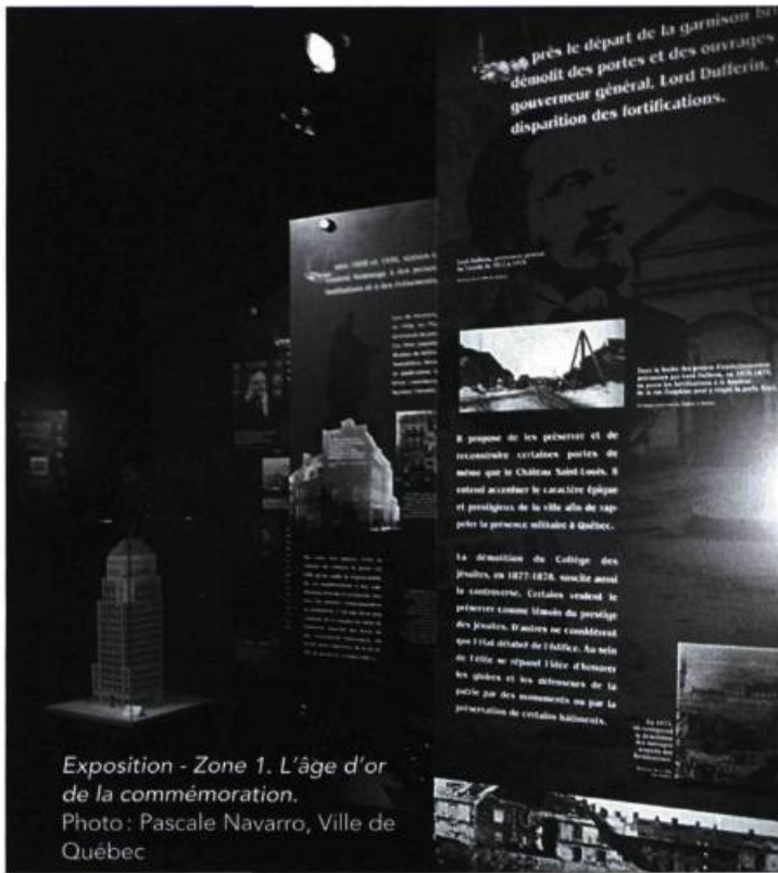
Exposition - Zone 1. L'âge d'or de la commémoration.

Cette approche nous a valu de francs succès. Archibus Québec, un concept de circuits d'architecture et d'urbanisme développé avec le Conseil des monuments et sites du Québec est fréquemment cité comme une réussite du genre. Son approche ludique de l'environnement urbain a plu aux jeunes autant qu'aux adultes. Nous sommes aussi particulièrement fiers d'avoir imaginé des activités telles que La ville imagée par l'enfant , À l'école de la ville , L'architecture et le fer . Avec ces programmes adaptés pour les enfants du préscolaire et du primaire, nous avons initié des milliers de jeunes de 4 à 12 ans à leur ville. Plus de 40 expositions ont également permis au grand public de mieux voir la cité sous des aspects parfois inattendus. La dernière exposition en date, Le Vieux-Québec, 1871-2008. Enjeux et débats , traite, comme son nom l'indique, des grands projets qui ont façonné Québec et des discussions qu'ils ont provoquées sur la place publique.