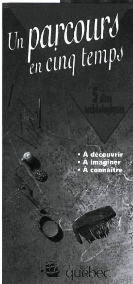
La Section de la diffusion du patrimoine de la Ville de Québec a publié depuis dix ans plusieurs ouvrages prisés.

l'heureux effet de mener à l'élaboration d'inventaires architecturaux fort complets ainsi qu'à des recherches historiques et archéologiques très intéressantes. Cette somme de connaissances acquises équivaut à une grande réserve muséographique dont on doit maintenant faire bénéficier le public, tant la population du Québec que les visiteurs intéressés à notre histoire.