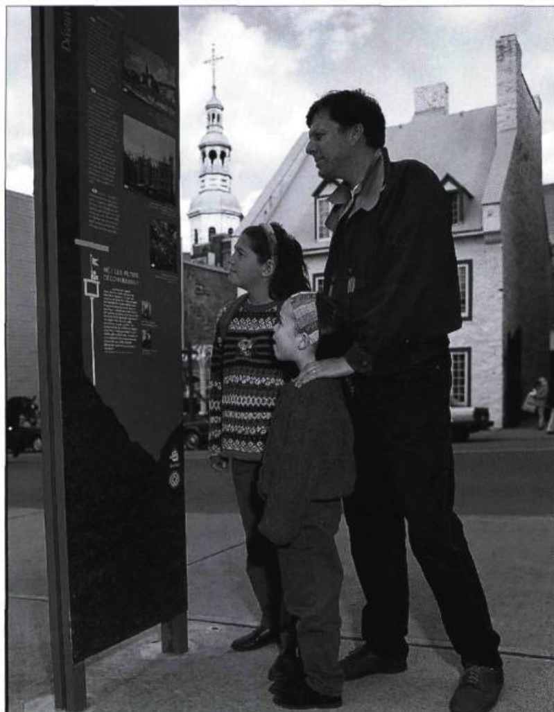
Les panneaux d'interprétation font maintenant partie du paysage urbain de Québec.