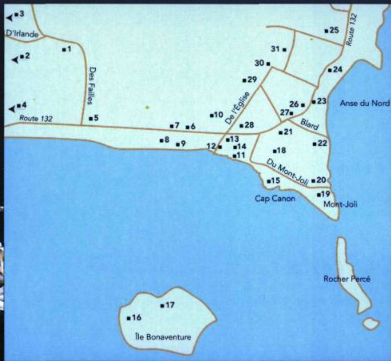
Île Bonaventure