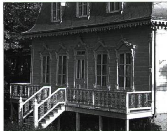
Des fioritures en bois ou en fonte complètent l'agrément des maisons de type éclectique.