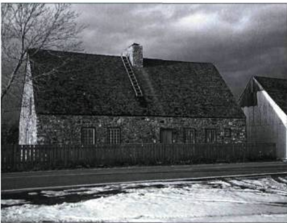
Les maisons d'« esprit français » sont encore nombreuses dans les six paroisses de l'île. Ces constructions se caractérisent, entre autres, par un toit aigu et par l'absence de rive et de larmiers.