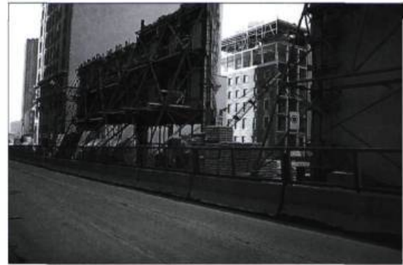
La protection du patrimoine dans un quartier historique ne peut se résumer à la fabrication de décors à partir d'éléments anciens. Ici, le Centre de commerce mondial, rue Saint-Jacques, en 1989.