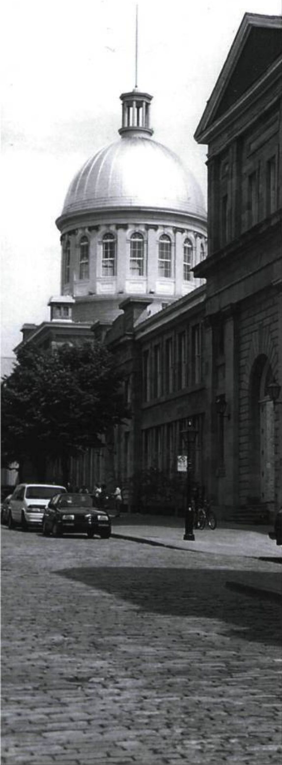
La portée des gestes posés dans l'arrondissement historique ne se mesure pas à l'aune des investissements, au nombre de bâtiments protégés ou de trottoirs refaits. Ici, la rue Saint-Paul et, en arrière-plan, le dôme du marché Bonsecours.