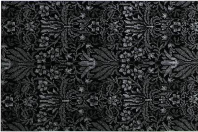
Laniev, vers 1840

que l'on expédie en ballots et que l'on assemble de façon à recouvrir entièrement le sol de la pièce, comme les moquettes d'aujourd'hui. Les couleurs de la pièce sont presque imposées par le choix du tapis. Ainsi, le choix des peintures, des tissus et des papiers peints découle-t-il de celui du tapis. Ce tapis, habituellement de couleur intense, constitue une présence visuelle importante dans la pièce. Les murs s'harmonisent avec cette couleur en prenant des teintes dégradées vers le haut.