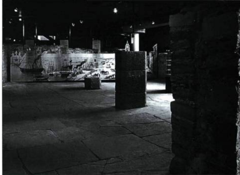
Au musée d'histoire et d'archéologie de Pointe-à-Callière, les nouvelles infrastructures laissent les vestiges dégagés.

À l'époque de restauration stylistique, plusieurs édifices restaient à l'état de « coquilles vides », aucune vocation n'ayant été planifiée dans le projet de restauration. Or, la seule restauration de l'enveloppe d'un