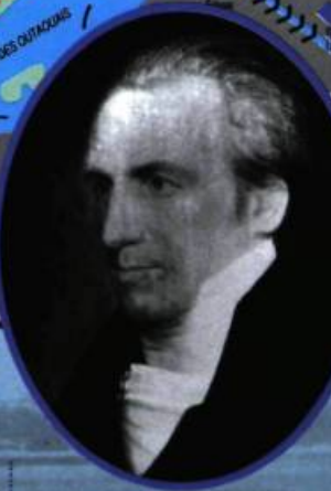
Philemon Wright 1760-1839