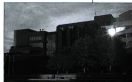
Maison du Citoyen.