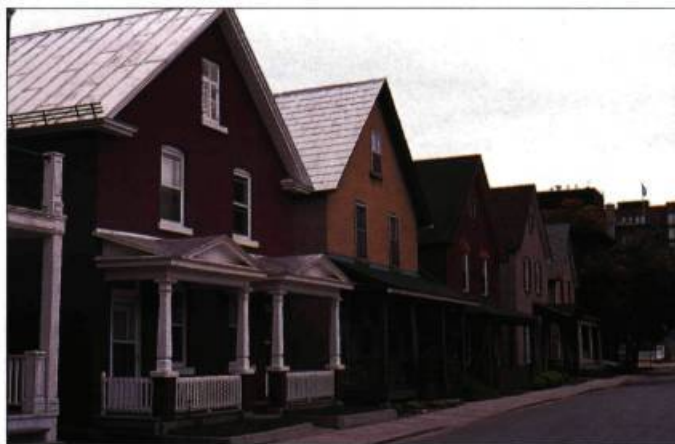
Maisons de type « hullois » de la rue Garneau.