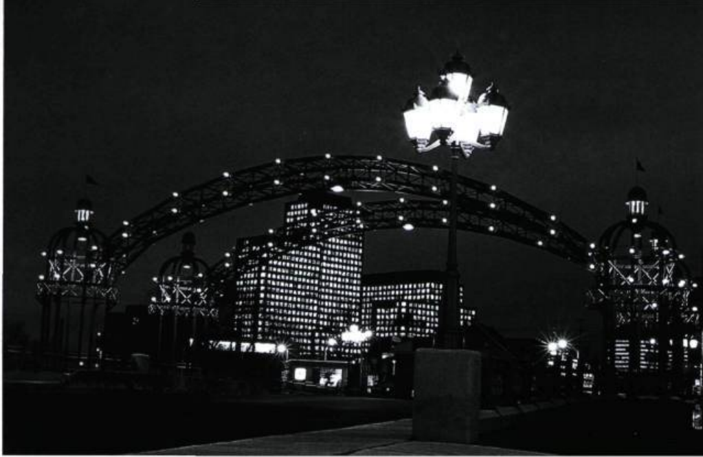
Le pont de la rue Montcalm.

L'architecture de cette maison, longue, haute et étroite, a été déterminée par la dimension des terrains sur lesquels elle est bâtie. Utilisant le bois à cause de l'abondance de ce matériau qui était transformé à Hull, la maison « hulloise » est construite de murs de madriers horizontaux, qui reposaient à l'origine sur des lambourdes posées par terre. Ses murs extérieurs étaient le plus souvent revêtus de planches de pin à la verticale, que le temps noircissait, parfois de bardeaux de cèdre naturel ou, plus rarement, de planches à déclin. La toiture à pignon sur rue est généralement recouverte de bardeaux de cèdre. Hautement inflammable, la maison hulloise est souvent comparée au tournant du siècle à de l'amadou parce qu'une douzaine de minutes suffisent à un incendie pour la détruire. Après ce qu'on devait appeler le Grand Feu du 26 avril 1900, la nouvelle maison hulloise, pareille à l'ancienne, est surnommée maison en « bois papillon », du nom d'un certain Papillon chargé par les grandes