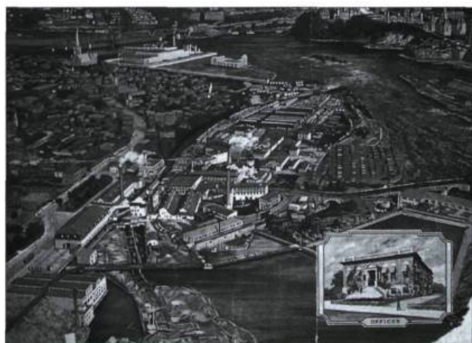
Illustration représentant une vue aérienne de Hull vers 1930.

Le grand Jos Montferrand, tableau de Joseph Saint-Charles, vers 1860.