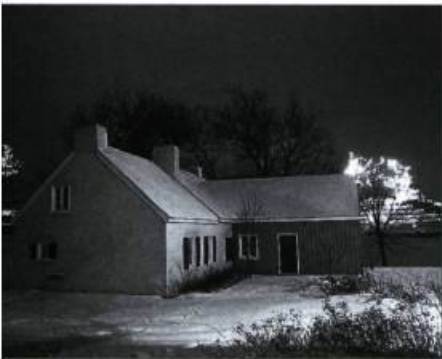
Ci-dessus, la maison Charron lors de la fête hivernale « Bal de neige ».