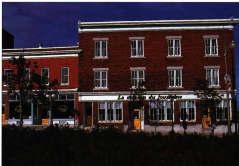
L'immeuble Boulton-Chénier, construit en 1920 et restauré en 1992, abrite aujourd'hui la maison du Tourisme.