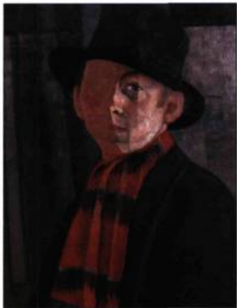
« Autoportrait » 1938, huile sur toile.