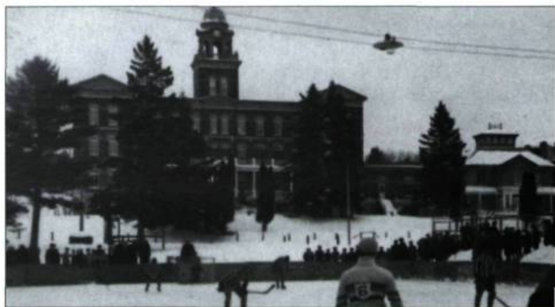
Une patinoire extérieure était entretenue durant l'hiver devant la façade principale du Collège Saint-Alexandre, comme le montre cette scène prise dans les années 1930. On aperçoit à droite l'ancienne villa à l'italienne construite par Alonzo Wright, qui fut intégrée aux bâtiments du collège.