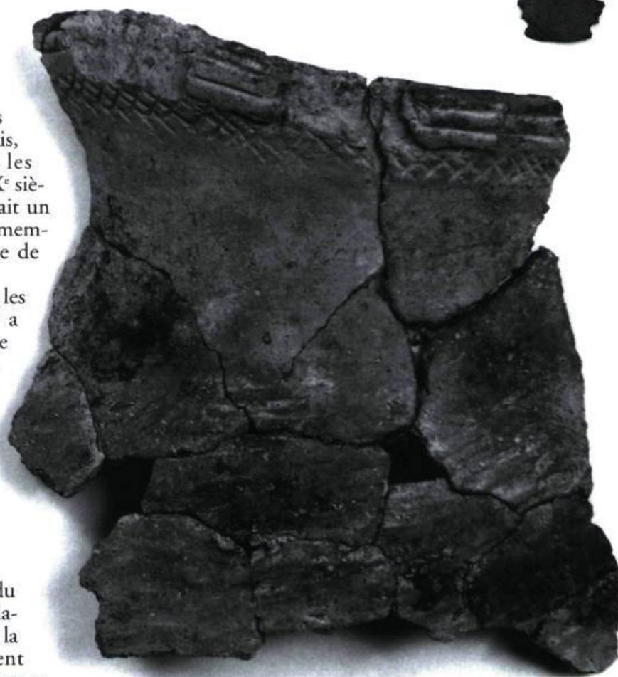
Fragments d'un vase en terre cuite signalant la présence d'habitants de la région des Grands Lacs dans le Parc du lac Leamy au XIV e ou XV e siècle.

Parallèlement à sa vocation agricole, le Parc du lac Leamy a été à l'avant-scène du développement