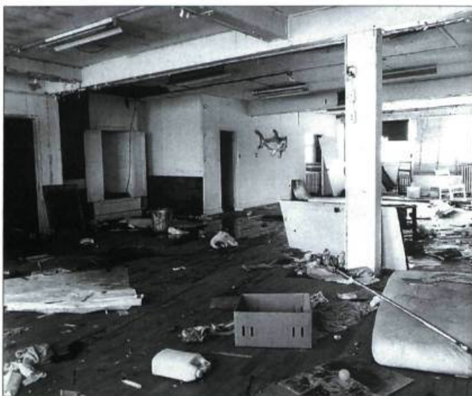
Les locaux de la côte d'Abraham étaient dans un état de délabrement avancé avant que ne soit entreprise l'aventure de Méduse.

Dans le même temps, la Ville réagissait en aménageant un parc-jardin. Ce nouvel aménagement est superbe, mais la proximité immédiate de la joyeuse anarchie de l'îlot Fleurie provoque un tel contraste que cela crée chez les visiteurs une sorte de choc esthétique. « On a l'air un peu broche à foin à côté, rigole Louis Fortier, mais on a un petit quelque chose de plus : ça déborde de vie de notre côté, alors que le parc Saint-Roch fait un peu guindé. Non que je critique l'aménagement de la Ville. Au contraire, je l'aime bien ce parc, car je suis convaincu que les citoyens vont un jour se l'approprier, le rendre vivant. »