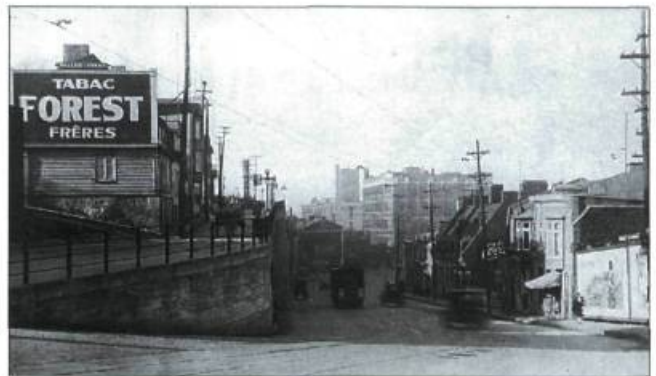
La côte d'Abraham vers 1940