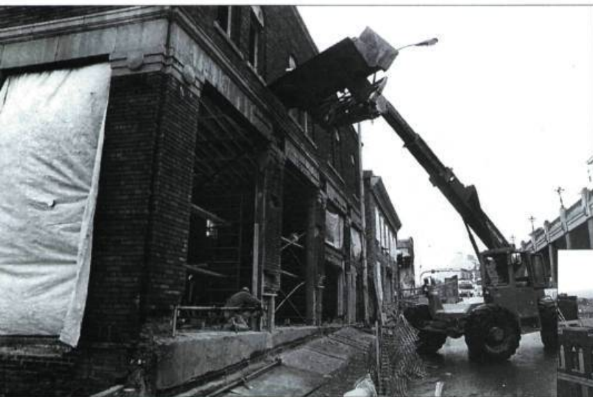
Méduse passera à la postérité pour le mégasauvetage auquel elle aura participé. Elle a redonné à Québec un lien entre la ville basse et la ville haute.