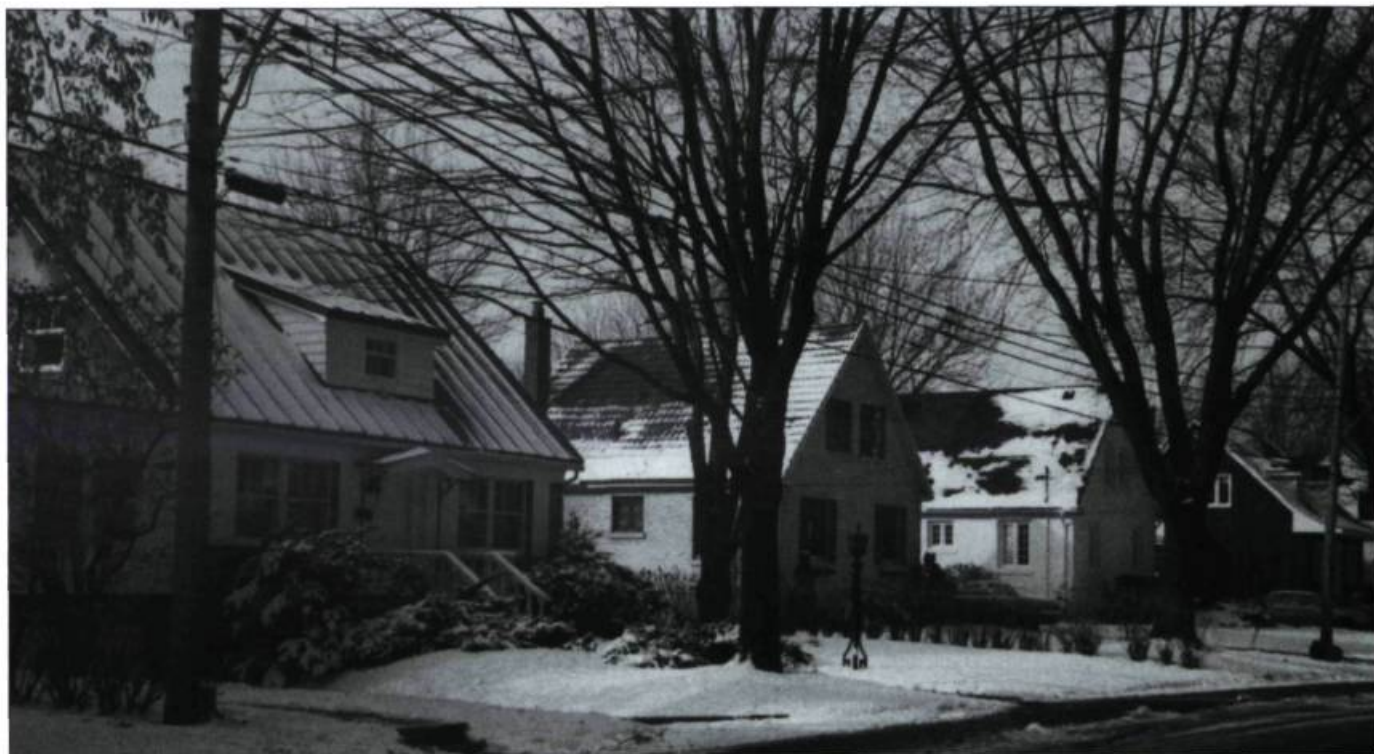
Maisons de la cité-jardin - Arrondissement Rosemont-Petite-Patrie

PAR JEAN-CLAUDE CAYLA, CONSEILLER EN AMÉNAGEMENT