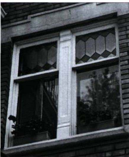
Motifs géométriques typiques de l'influence du mouvement « Prairies » vers la fin de la période de production du vitrail.

Le vitrail se caractérise par une composition de pièces de verre clair ou coloré assemblées à l'aide de fines membrures structurales de plomb où du mastic tient lieu de liant. Cet ensemble de « verres plombés » intégré dans un cadre structural est maintenu d'aplomb grâce à une armature de pièces verticales et horizontales : les vergettes et les barlotières.