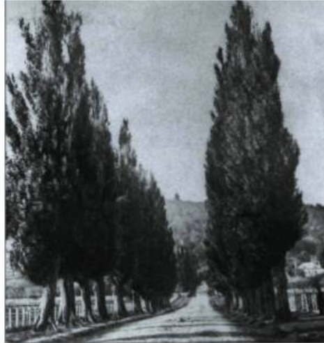
Vers 1860, une allée de peupliers bordait le chemin du Mile-End, ce qui rendait le chemin plus solennel, en particulier lors du passage des cortèges funèbres vers les cimetières de la montagne.

Ce lotissement dense et régulier, avec ses lots de 25 pieds de large, respecte la nouvelle typologie résidentielle développée à Pointe-Saint-Charles et utilisée partout à Montréal à cette époque. Contrairement aux maisons de type villageois ou faubourien (qui existent toujours sur la rue Coloniale au nord de Rachel) dont les pièces en enfilade et parallèles à la rue respectent la tradition montréalaise du XVIII e siècle, les nouvelles maisons érigées sur le territoire de la ferme Comte s'alignent perpendiculairement à la rue et leurs pièces se présentent en enfilade dans la profondeur du lot. Seule la rue Saint-Denis fait figure de rue prestigieuse par l'importance de son emprise et de ses lots. Le décor préfabriqué des façades est plus orné et varié pour les maisons de la classe moyenne.