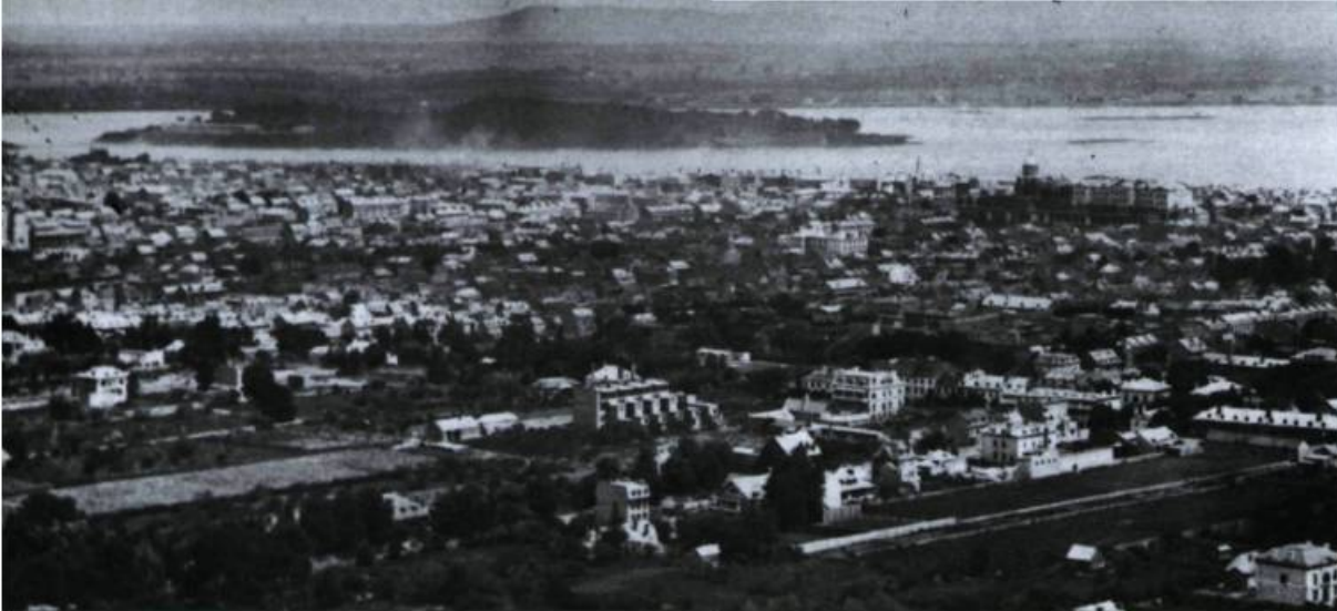
La ville de Montréal vue de la montagne en 1865. Le développement de la ville se fait par lotissement de différents cadastres coloniaux. En avant-plan, au centre, maisons en rangée, rue University. À droite, le réservoir McTavish. En arrière-plan, l'église Notre-Dame, le Palais de justice sur le Champ de Mars et la coupole du marché Bonsecours.