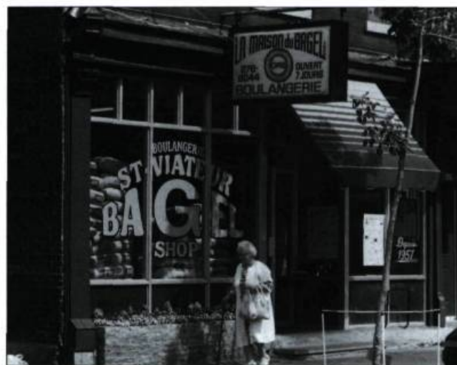
Bagels et « smoked meat » : étrangetés il y a 100 ans, on les considère aujourd'hui comme tout à fait montréalais, au point de les vanter aux touristes.