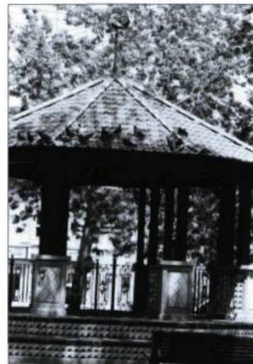
Parc du Portugal, angle Saint-Dominique et Vallières. Interprétant la culture portugaise, les designers municipaux qui ont composé l'aménagement de ce petit parc de quartier ont coiffé le kiosque à musique d'un coq !

La présence des Portugais au Plateau date des années 1960. Parmi les premiers arrivants, on remarque nombre d'intellectuels, opposants réprimés par le régime de Salazar, ainsi que des jeunes objecteurs de conscience qui refusent de joindre l'armée coloniale portugaise en Afrique. Les Portugais de la deuxième vague viennent de régions rurales, notamment des Açores, et sont davantage mus par des motifs économiques. Ce sont eux qui, en s'installant vers 1970 autour des rues Coloniale, de Bullion, Roy, ou Rachel, vont contribuer à freiner la détérioration de ce