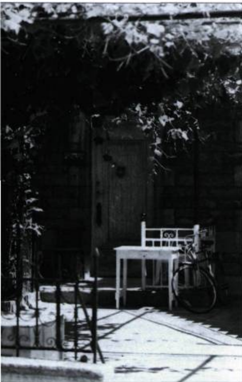
Cette vigne en façade sur la rue Esplanade (angle Marie-Anne) s'offre au regard au promeneur dans un quartier miraculeusement sauvé des bouleversements des années 1960.

L'après-guerre, c'est aussi l'arrivée de la communauté grecque, qui tisse encore une fois le lien entre lieux de travail et lieux d'installation. Les premiers commerçants ont bientôt pignon sur l'avenue du Parc, vite surnommée la « Petite Athènes ». On y trouve un cinéma grec (le Rialto, près de la rue Bernard), des banques grecques, l'Association des travailleurs grecs et les premiers restaurants qui enseigneront aux Montréalais les mots souvlaki et baklava . Le Plateau a été pour les Grecs un lieu de passage, puisqu'en quelques années la communauté se déploie vers le nord, notamment dans le quartier Parc-Extension.