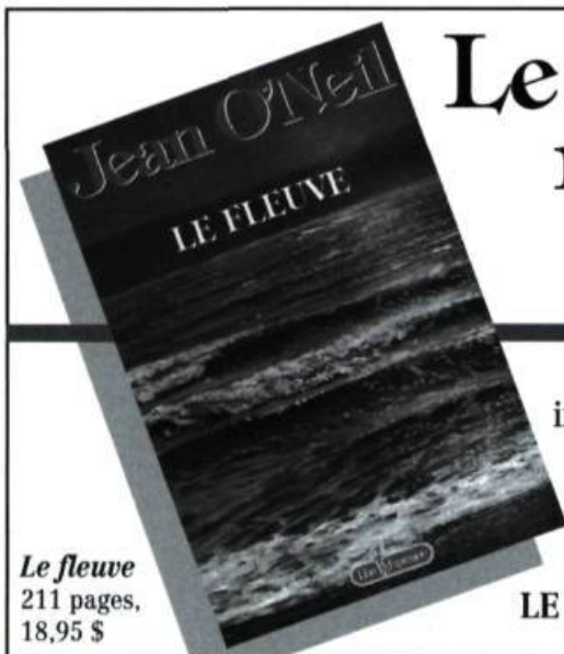
Le fleuve 211 pages, 18,95 $

Je souhaite que le Saint-Laurent soit reconnu comme la première valeur nationale, qu'il soit notre fierté. Une maman fière de son enfant ne l'habille pas en guenilles pour aller à la parade. Quand nous aimerons le fleuve assez pour qu'il soit notre fierté, il n'y en aura plus de problème.