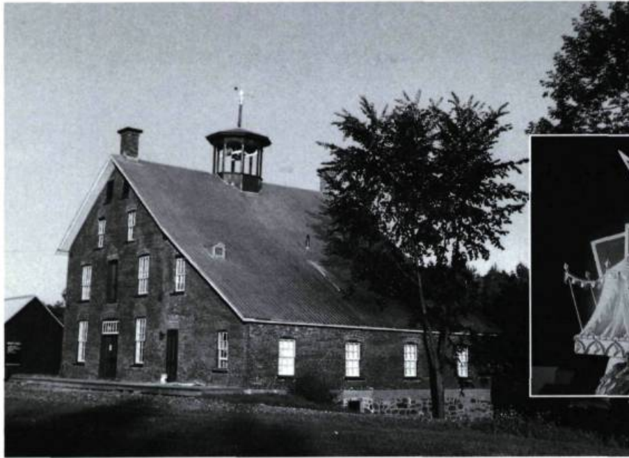
Le vieux moulin date du début des années 40. Il est l'un des six bâtiments restaurés par le théâtre de la Dame de cœur.