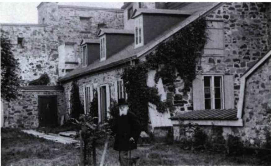
Résidence privée au début du siècle, cette demeure donne sur la cour intérieure du fort Chambly.