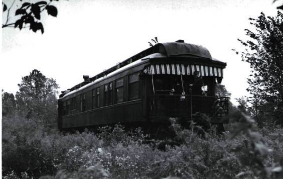
La voiture privée de sir William Van Horne au Musée ferroviaire canadien de Delson/Saint-Constant.

Collection : Association canadienne d'histoire ferroviaire