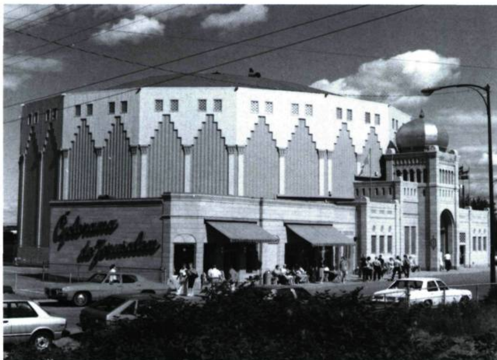
La rotonde qui abrite le Cyclorama de Jérusalem, à Sainte-Anne-de-Beaupré.

Situé à deux pas de la basilique de Sainte-Anne-de-Beaupré, le Cyclorama de Jérusalem présente, sur une immense toile circulaire, Jérusalem, le jour de la crucifixion . La surprise est grande lorsqu'après être entré dans la rotonde, on découvre dans la salle sombre, depuis une plateforme, une toile haute de 14 mètres et d'une circonférence de 100 mètres, qui reproduit la ville de Jérusalem et le mont des Oliviers. La technique du trompe-l'œil, alliée à l'éclairage prove-