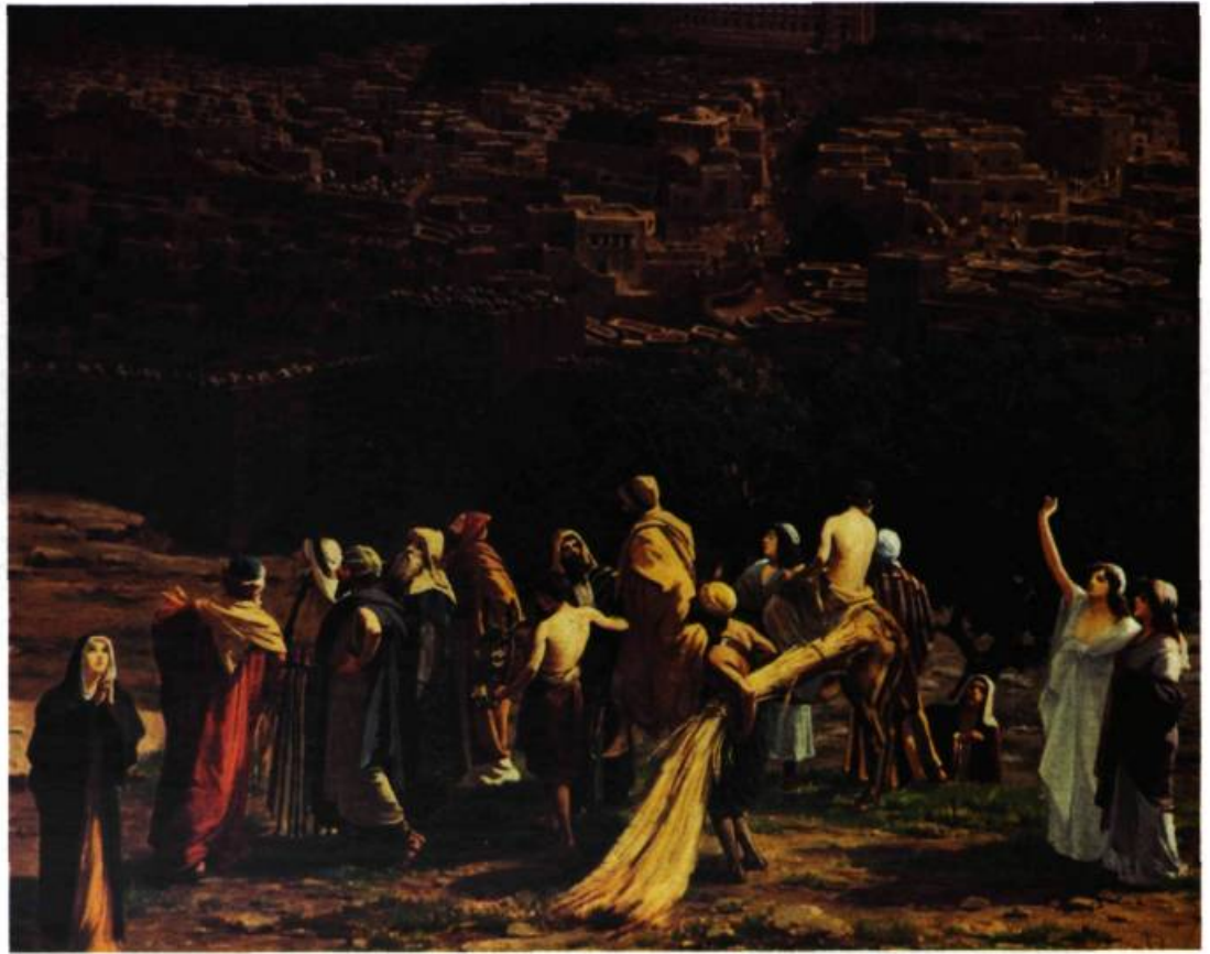
La physionomie des différents personnages est tout à fait saisissante.

Dans le dernier quart du XIX e siècle, à Paris, le colonel Langlois inaugura les « faux terrains », c'est-à-dire des avant-plans en trois dimensions qui se confondaient avec la scène peinte, suspendue derrière. Félix-