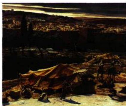
Les tentes des marchands arabes – les «faux terrains» – sont particulièrement remarquables pour leur rendu.