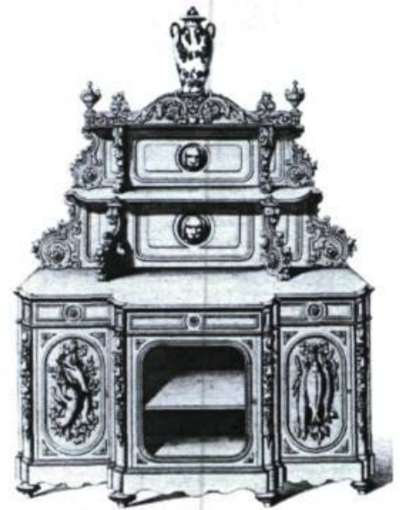
Au milieu du XIX e siècle, les buffets de salle à manger sont le plus souvent dans le style néo-Renaissance. Planche n° 441 du Garde-Meuble Ancien et Moderne/Collection de Meubles (Paris, XIX e siècle), provenant du fonds du meublier québécois Honoré Roy dit Belleau. Collection du Service canadien des parcs, région du Québec.

Plus qu'un reflet fidèle des époques antérieures, la propension à puiser aux formes du passé nous transmet du XIX e siècle, par l'intermédiaire du mobilier et des décors intérieurs, un portrait de ses goûts et de ses ambitions.